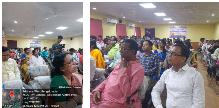
The participants with keen attention to the speaker's key note address